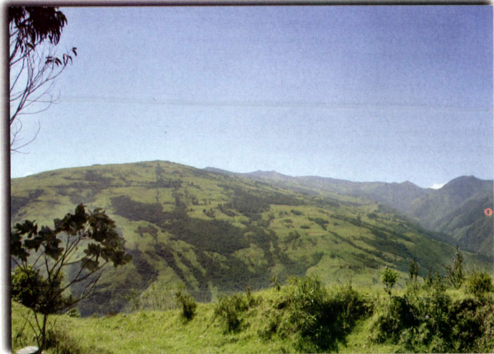
Barragán Devia A. W.

Destacamos la colaboración de organizaciones comunitarias como Asocombia, Páramos y Frailejones, Corponogales, Comercializadora Agropecuaria de Alegrías y Asotenerife, y de igual forma a las comunidades de Alegrías, Barragán, Santa Lucía, El Placer, Los Andes, Tenerife, Combia y La Nevera por todo su apoyo en esta iniciativa de aproximación y conocimiento a las realidades biofísicas y socioculturales en las tierras altas del Valle del Cauca.